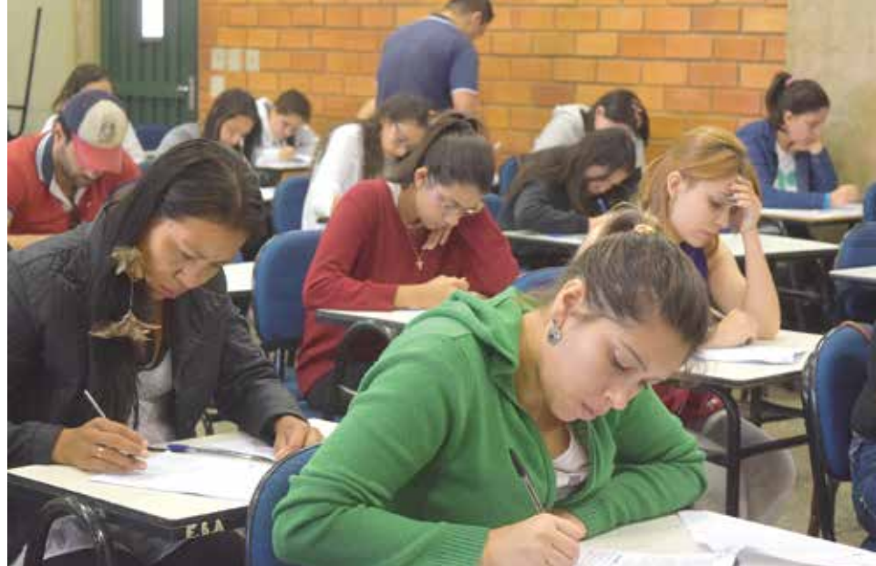
Inscrições para o Vestibular podem ser feitas até 22 de junho pelo site da UCDB

Nos cursos presenciais, com exceção do curso de Direito, as vagas com início em 2016B são remanescentes, com matrículas efetivadas no segundo semestre nas turmas iniciadas em 2016A. As oportunidades são para as graduações em Administração, Agronomia, Análise e Desenvolvimento de Sistemas,