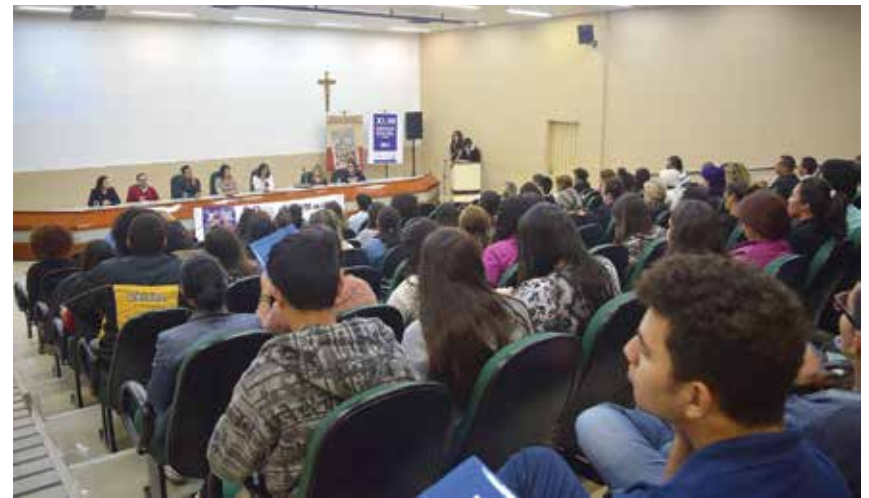
De 17 a 19 de maio foi realizada a 43ª Semana de Serviço Social da Católica

Na UCDB, curso é oferecido há 44 anos, ajudando a profissionalizar a área em Mato Grosso do Sul