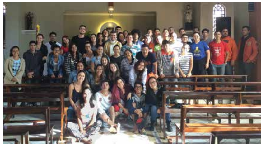
Acampamento de Páscoa da Pastoral teve a participação de 65 pessoas

A Pastoral é um espaço aberto a todos, pela manhã, à tarde e à noite! Venha nos fazer uma visita!