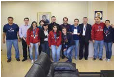
Atletas do futsal feminino

Equipes de basquete e handebol masculino, além do futsal feminino disputam agora etapa nacional da competição