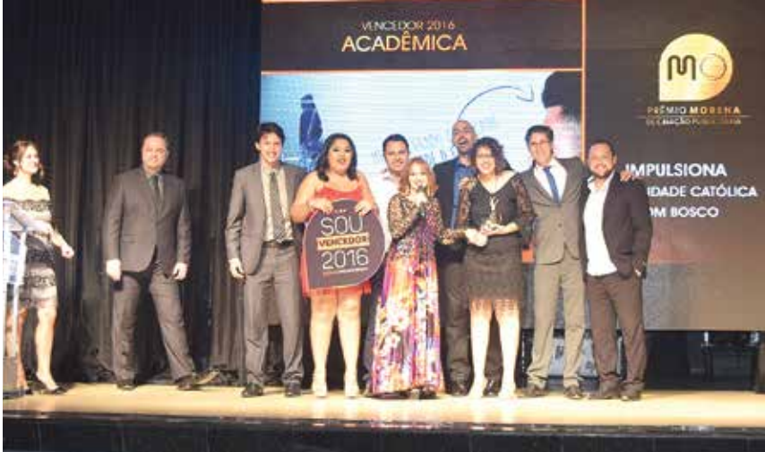
Acadêmicas e professores recebem o sexto troféu conquistado pelo curso de PP