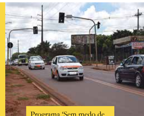
Programa ‘Sem medo de dirigir’ é gratuito

Para participar, a pessoa precisa ter acima de 18 anos, se inscrever pelo telefone (67) 3368-0161, pelo qual será realizado o primeiro encontro e posteriormente encaminhados para