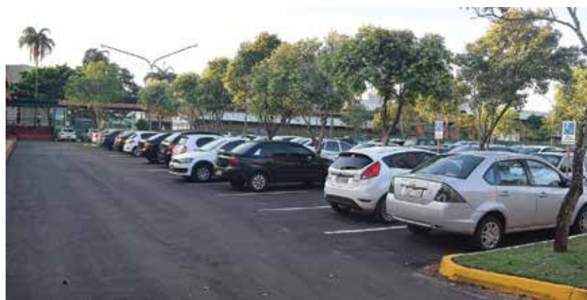
As vagas especiais devem ser respeitadas para evitar multas e garantir a acessibilidade

Os veículos estacionados nas vagas reservadas para idosos e deficientes físicos deverão estar com a credencial sobre o painel, em local visível para a fiscalização. Em Campo Grande, o cadastro para solicitar a carteira de estacionamento para vagas especiais pode ser feito por meio do endereço eletrônico http://apl04.pmcg.ms.gov.br:8080/sigaweb/index.zul . A UCDB está preparando uma campanha de conscientização e alerta para todos os condutores de veículos sobre a vigência da Lei, contribuindo para o respeito às regras de trânsito.