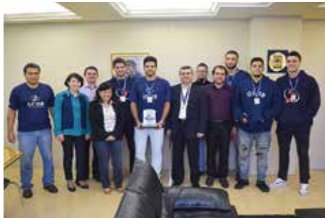
Equipe de basquete masculino