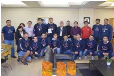
Time de handebol masculino