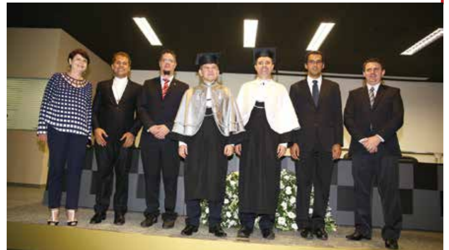
Nova composição do Conselho de Reitoria da UCDB