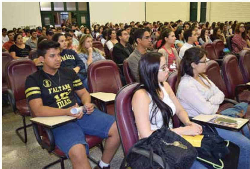
Atividades da iniciação científica acontecem na UCDB desde 1994

Aos poucos, acadêmicos, pesquisadores e docentes começaram a se interessar pelo projeto de iniciação científica, tanto que, em 1994, a UCDB contava apenas com