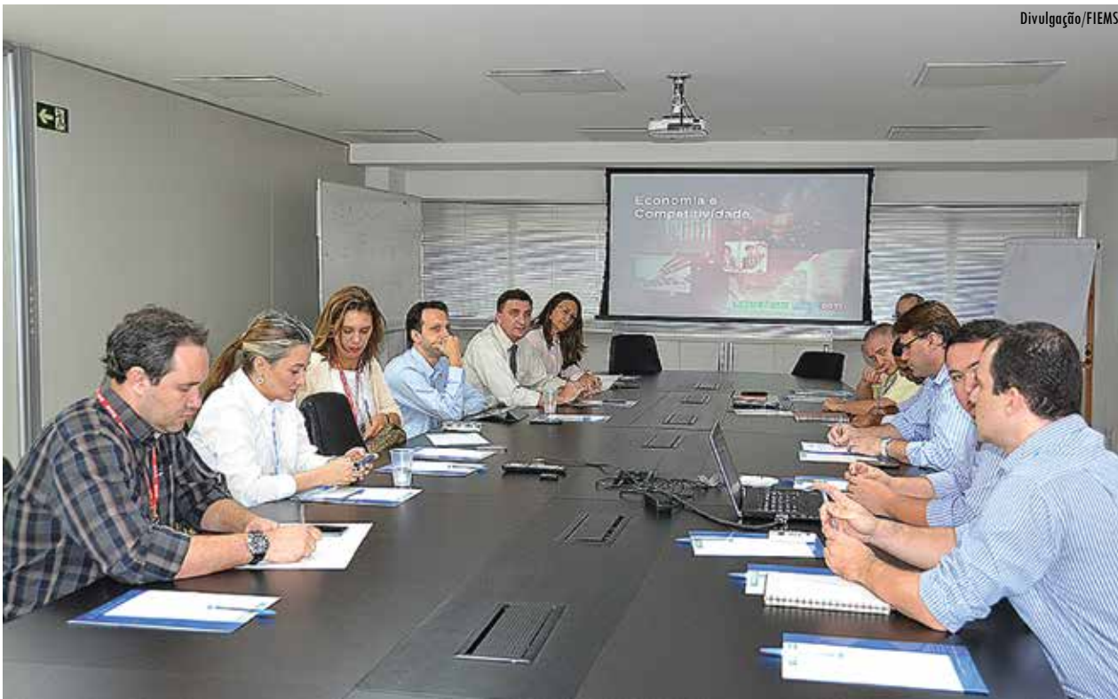
Representantes de universidades e órgãos públicos têm reuniões periódicas para viabilizar o projeto