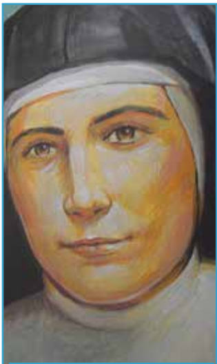
MARIA DOMINGAS MAZZARELLO