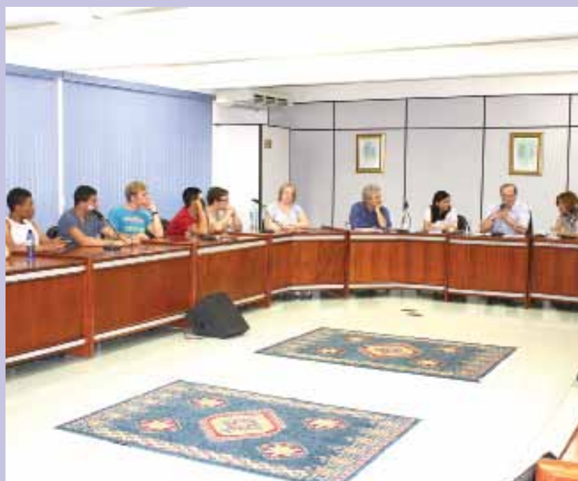
Uma das parcerias mais recentes foi com a Universidade de Washington

Outro ponto que tem se destacado no curso é a internacionalização. “Hoje é extremamente importante trocar experiência e assimilar as coisas boas. Esse caminho de encontrar parcerias internacionais não tem mais volta, por isso estamos sempre abertos a este tipo de ação. Atualmente temos parceria com instituições argentinas, alemãs, canadenses, espanholas e norte-americanas, o que beneficia não só os acadêmicos, mas também nosso corpo docente”, disse o coordenador.