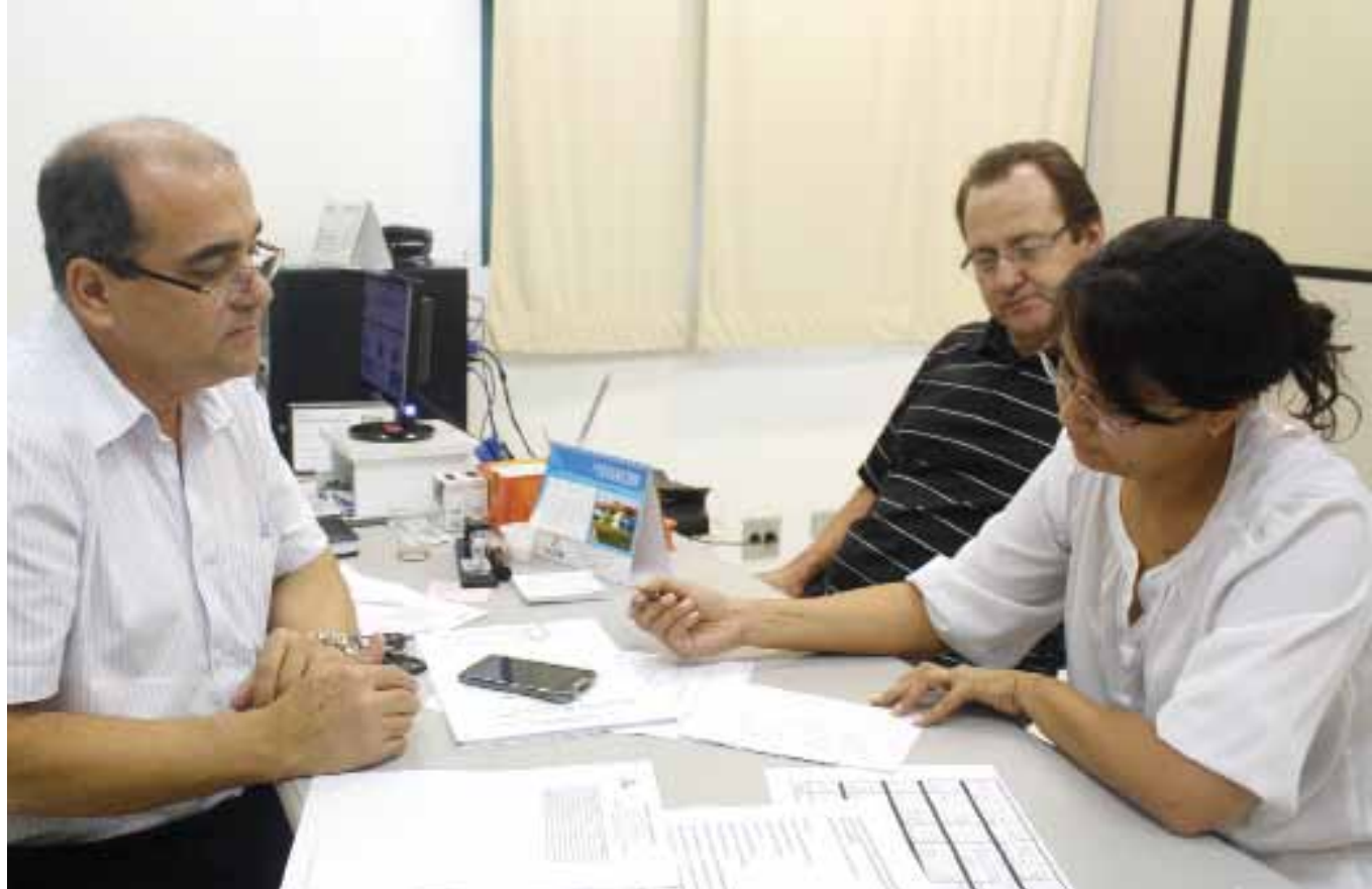
No Nuprajur, acadêmicos atendem casos reais, ajudando a comunidade e aprimorando conhecimentos

do a 5ª Vara do Juizado Especial Cível e Criminal, fruto de um convênio celebrado entre o Tribunal de Justiça de Mato Grosso do Sul e a Universidade Católica Dom Bosco, e ainda a Justiça Itinerante, outro projeto parceiro do Tribunal de Justiça, que leva atendimento na área.