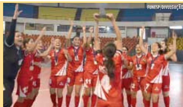
Equipe de Futsal feminino representará Capital nos Jogos Abertos de MS