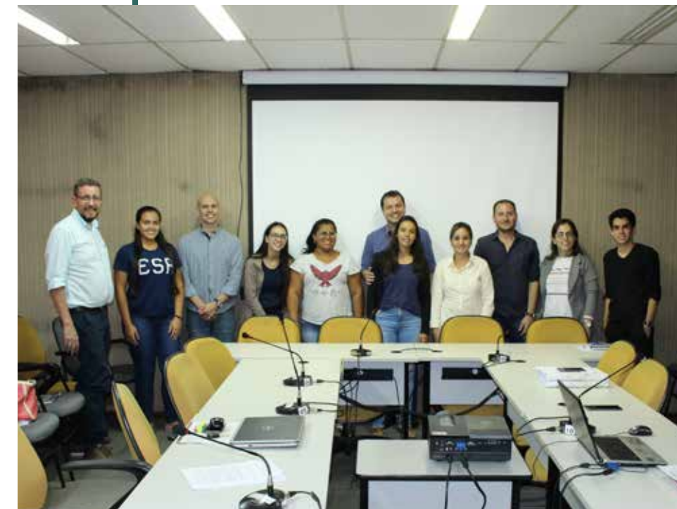
Parte da equipe de trabalho da UCDB e Planurb

vação do relatório de detalhamento da metodologia proposta preliminar do plano de trabalho; o segundo é o Relatório da 1ª Oficina de Planejamento; o terceiro, documento síntese da APA (encartes 1, 2 e 3); o quarto é o Planejamento da APA; e o último, a versão final do Plano de Manejo da APA do Ceroula.