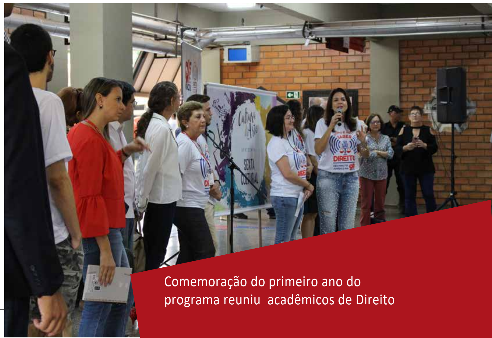
Comemoração do primeiro ano do programa reuniu acadêmicos de Direito

O programa tem o apoio do Diretório Acadêmico Clóvis Beviláqua (Daclobe) e se tornou também um projeto de iniciação científica (Pibic). São dez horários de exibição, diariamente: 6h35, 7h45, 11h35, 12h35, 13h35, 15h35, 16h35, 17h35, 18h35, 22h30, veiculado na FM Educativa UCDB (91,5 MHz).