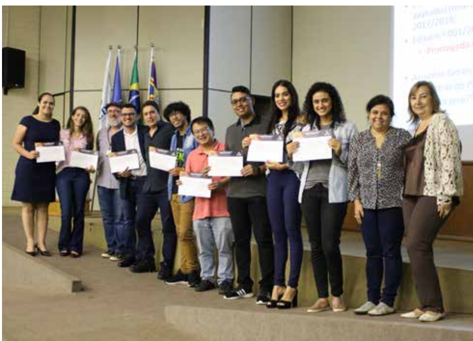
Professores e orientadores premiados