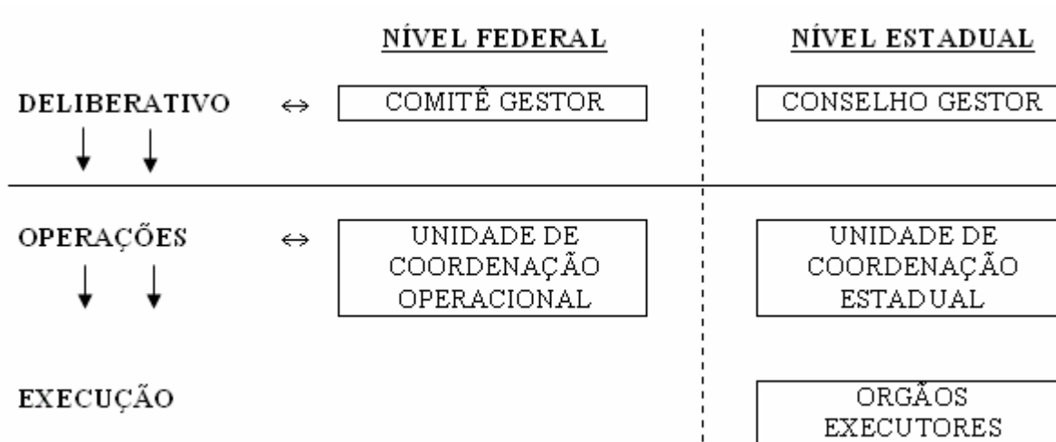
Figura 1 - Organograma Institucional