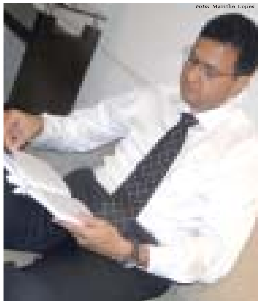
Advogado - Serviço público indispensável à administração da justiça

sa Magna Carta, todo advogado presta serviço público e é indispensável à administração da justiça. O Código de Ética é importante para delimitar como o grupo de profissionais deve agir criando uma linha de conduta básica que preserve o bem público. A ética profissional impõe-se ao advogado em todas as circunstâncias de sua vida profissional e pessoal que possam repercutir no conceito público e na dignidade da advocacia. Os deveres éticos consignados no Código não são recomendações de bom comportamento, mas normas jurídicas que devem ser cumpridas, sob pena de punição.