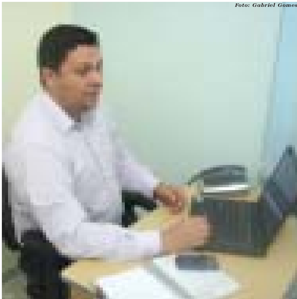
Equilíbrio - a ética contribui para a humanização e equilíbrio social das pessoas