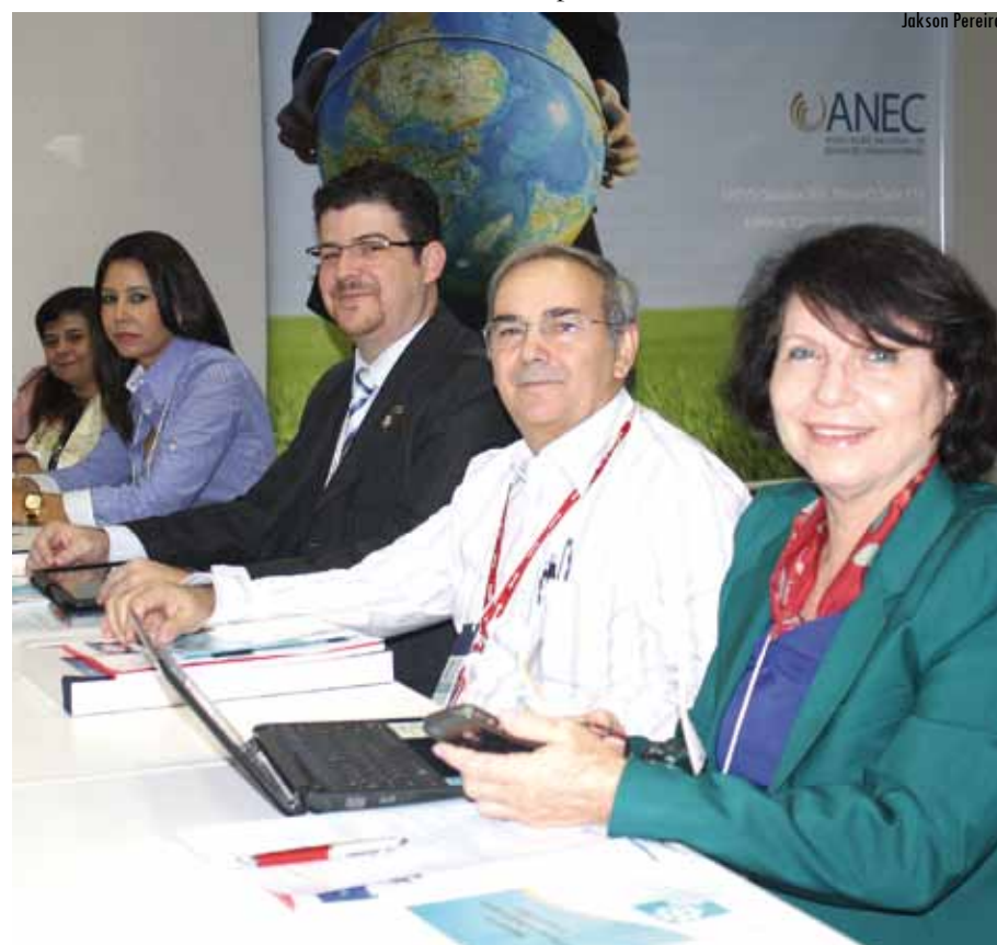
UCDB contou com diversos representantes de área no Fórum da ANEC

católica têm uma série de tarefas como formar lideranças, formar o espírito crítico, produzir conhecimento, e tudo tem de ser feito na caridade, no amor.