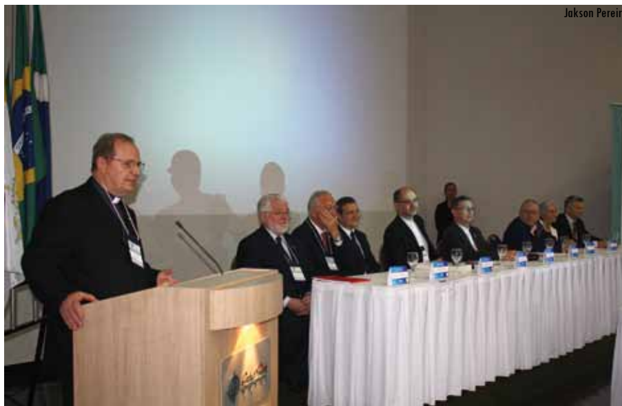
Abertura do evento na Capital reuniu reitores de diversas instituições católicas