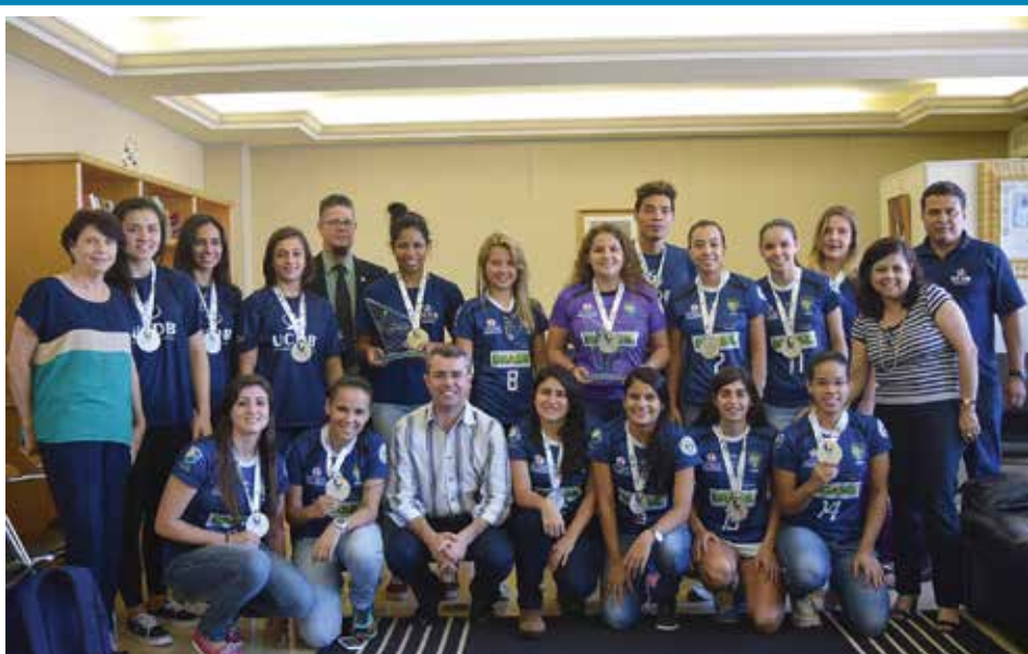
Atletas medalhistas do JUBs participaram de reunião com Reitor e Pró-Reitores da UCDB