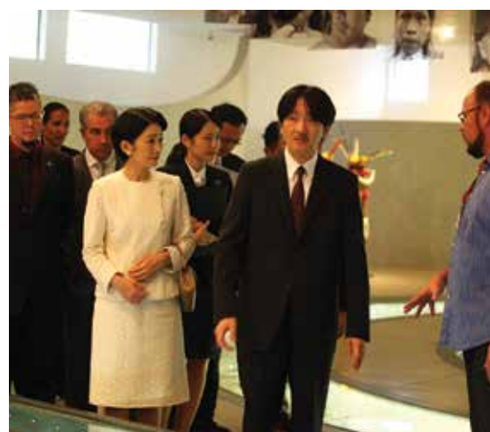
Princesa Kiko e príncipe Akishino