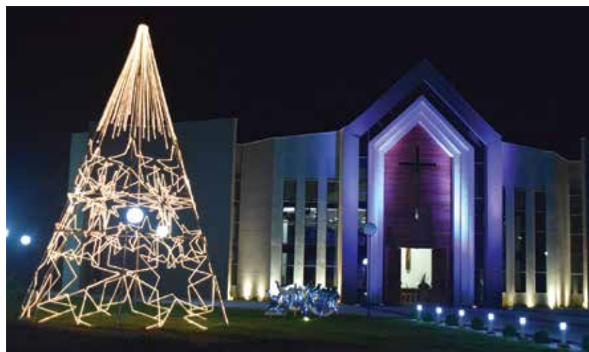
Missas aos domingos acontecem a partir das 19h15 na UCDB

Desde a fundação da Instituição (1993), as tradicionais missas eram realizadas, nas capelas ou no anfiteatro. A igreja, que está localizada entre os blocos A e C, tem capacidade para receber 520 pessoas. Mais informações podem ser obtidas pelo telefone (67) 3312-3429.