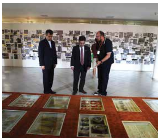
Passagem do cônsul pela coleção entomológica

O Museu das Culturas Dom Bosco recebe, por ano, mais de 12 mil pessoas, em sua maioria crianças. O local está aberto de terça-feira a domingo, das 8h às 16h45.