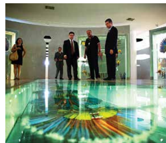
Artefatos etnológicos encantaram visitantes